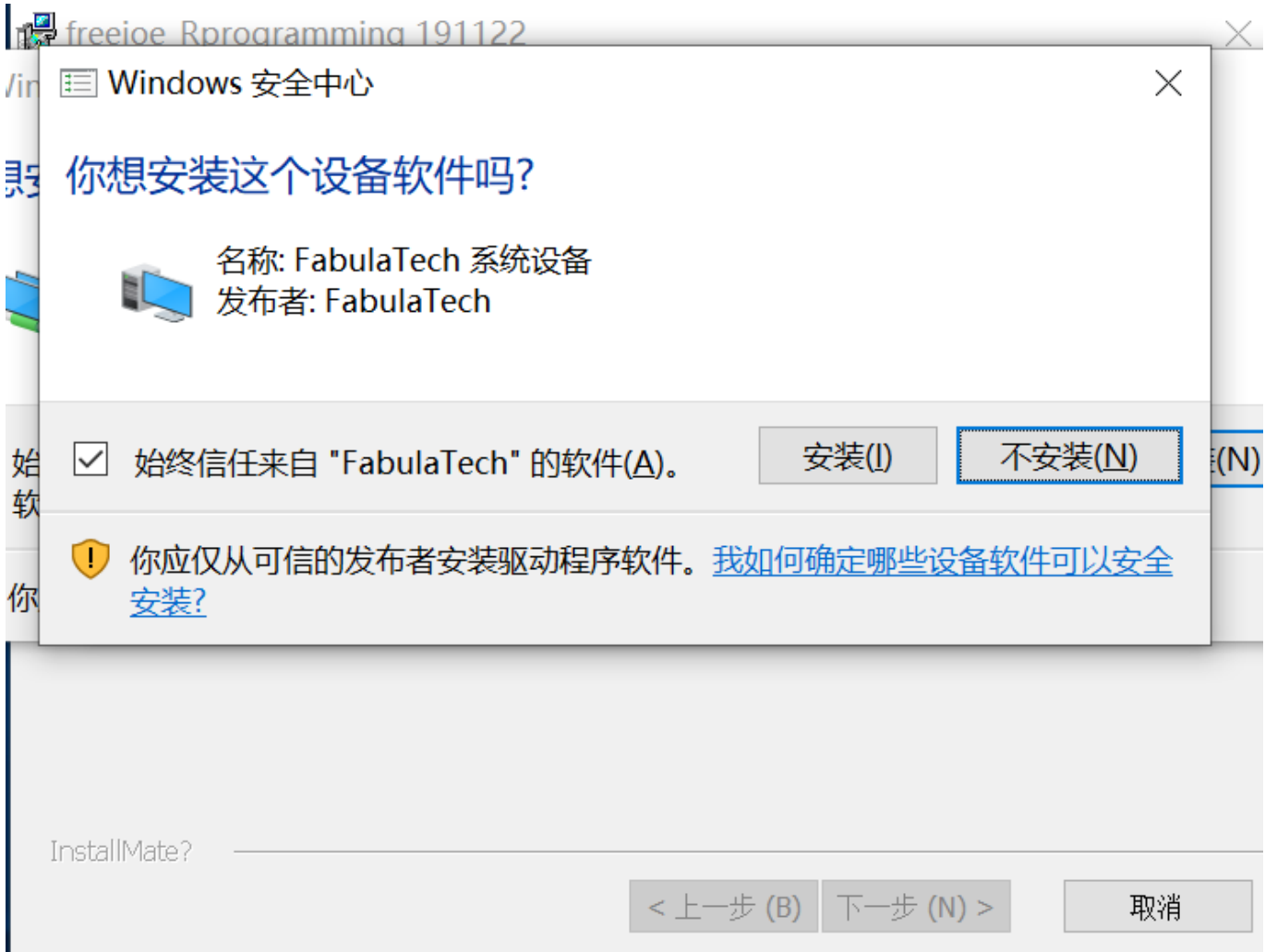
安装界面4，安装虚拟网络驱动：